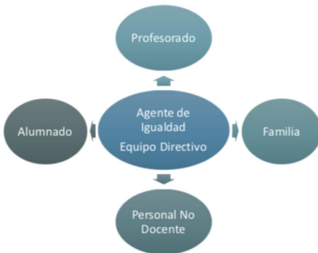
Diagrama del Grupo de Trabajo coordinado por el Equipo Directivo.