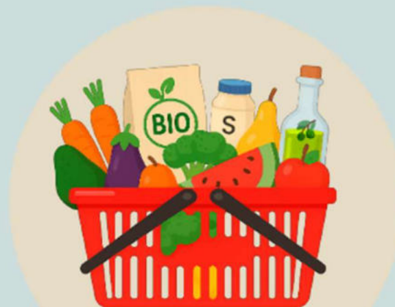
Cesta de la compra